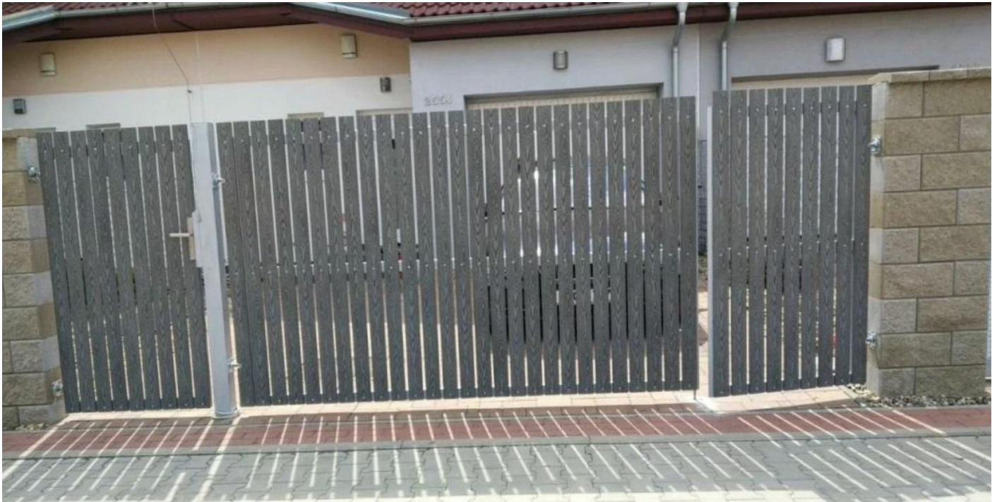
Příklad obdobného plotu s WPC plotovkou